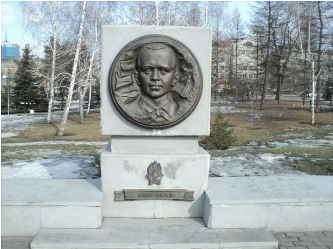
Памятник Марату Казею на Аллее пионеров-героев