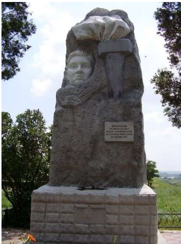
Памятник Муси Пинкензону в Усть-Лабинске