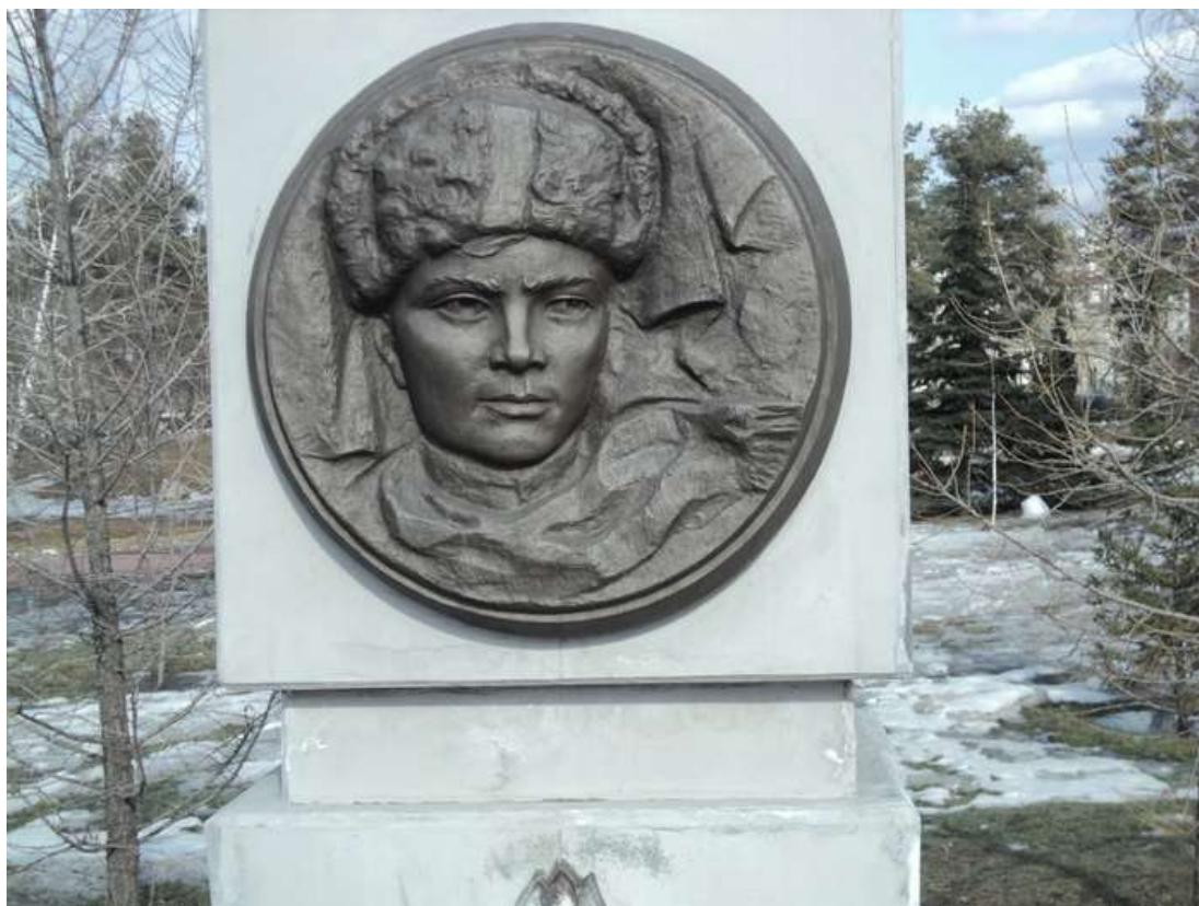
Памятник Вале Котику на Аллее пионеров-героев

фашистскими захватчиками, занявшими его родной город. Мальчик помогает своему партизанскому отряду осуществлять слежку за врагом и добывать оружие. В один день, оказавшись в окружении гитлеровцев, школьник совершает подвиг, подорвав себя гранатой.