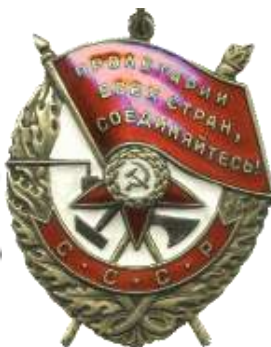
Орден Отечественной войны Орден Красного Знамени