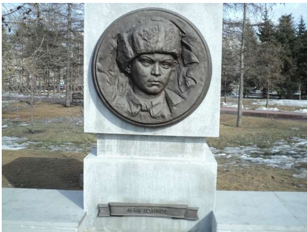
Памятник Лёне Голикову на Аллее пионеров-героев