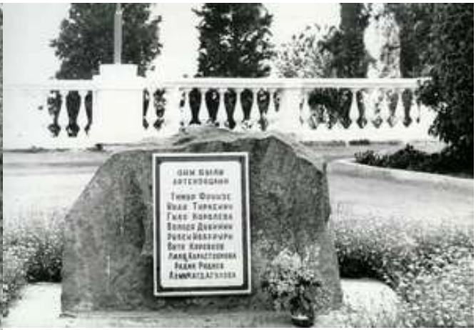
Мемориальная доска с именами героев-артековцев, погибших в годы Великой Отечественной войны (1941-1945) . Детский лагерь «Лазурный», Крым