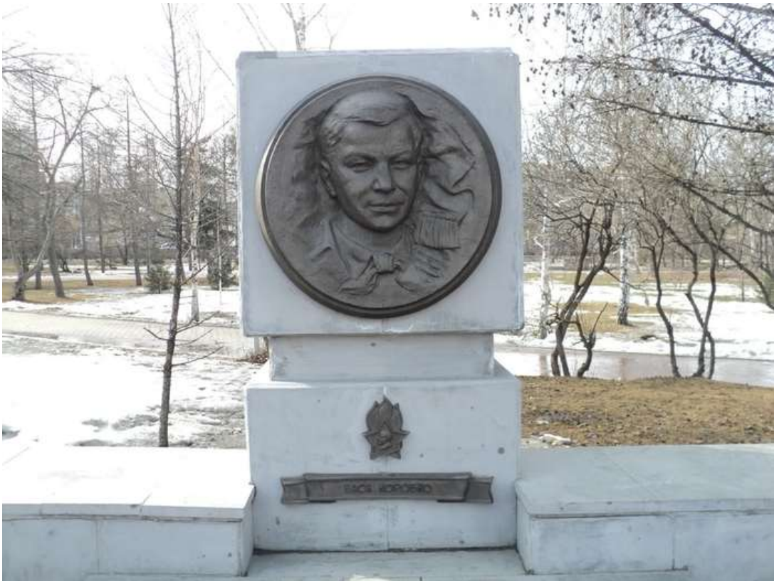
Памятник Васье Коробко на Аллее пионеров-героев