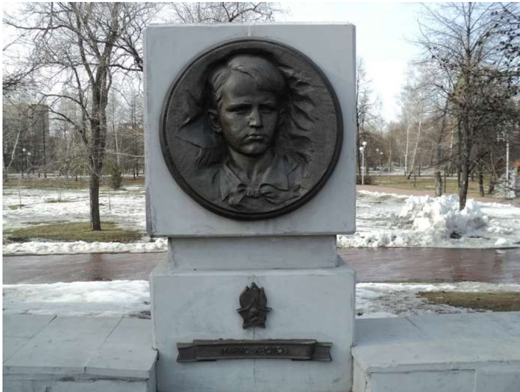
Памятник Марксу Кротову на Аллее пионеров-героев