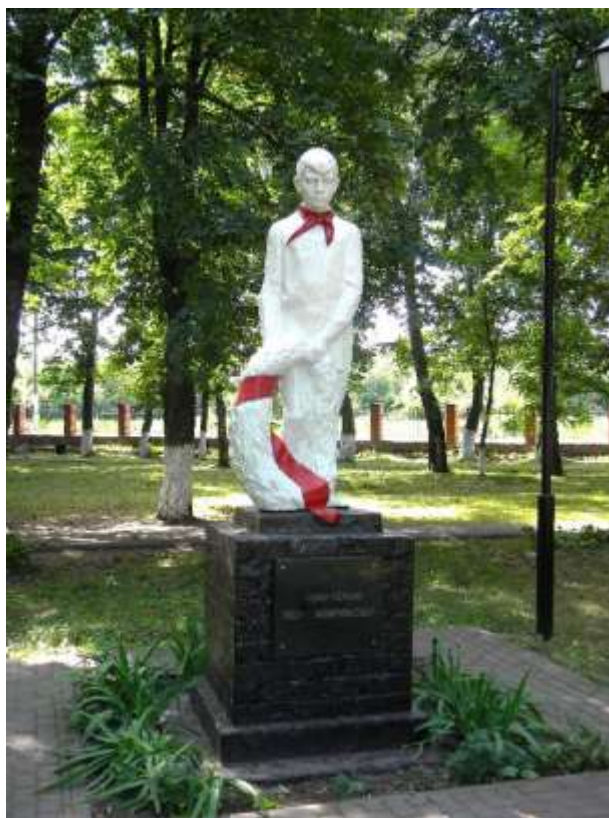
Памятник пионеру-герою Лёне Жирякову в п.г.т. Теткино, Курская обл., Россия