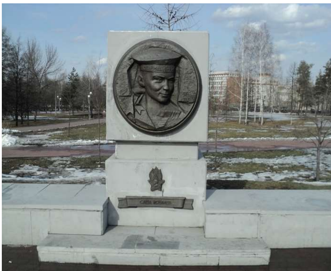
Памятник Саше Ковалеву на Аллее пионеров-героев