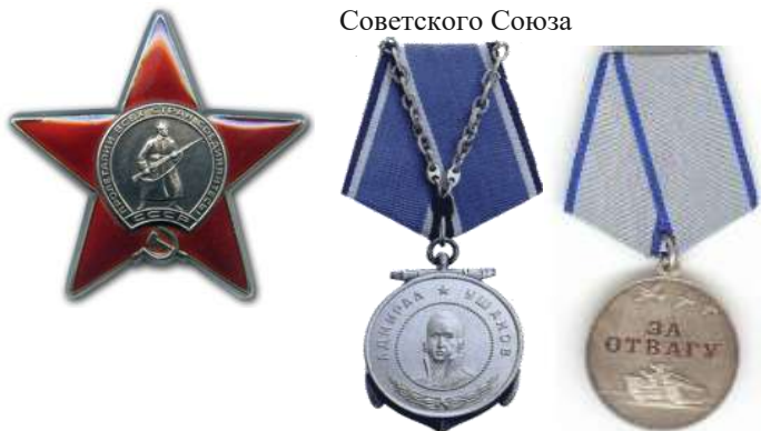
Медаль Ушакова Медаль за отвагу Орден Красной звезды