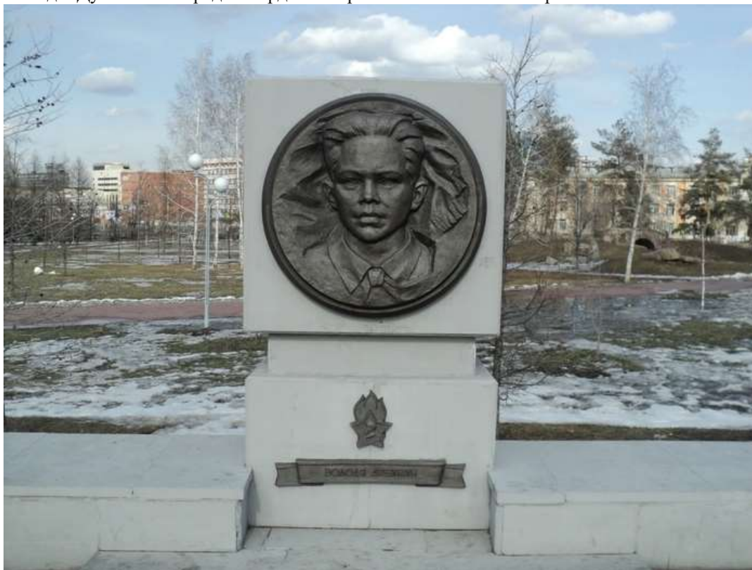
Памятник Володе Дубинину на Аллее пионеров-героев

Радость встречи омрачило то, что гитлеровцы заминировали землю вокруг Старокарантинских катакомб, поэтому взрослые партизаны не смогли бы их покинуть. И тогда Володя вызвался быть проводником у сапера. 4 января 1942 г. Володя Дубинин подорвался на mine вместе с четырьмя саперами. Похоронили всех в братской могиле в Молодежном парке г. Керчь. За совершенные подвиги Володю Дубинина наградили орденом Красного Знамени посмертно.