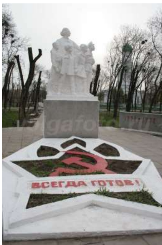
Памятник "Крупская и пионеры" в Энгельсе, Саратовская обл., Россия