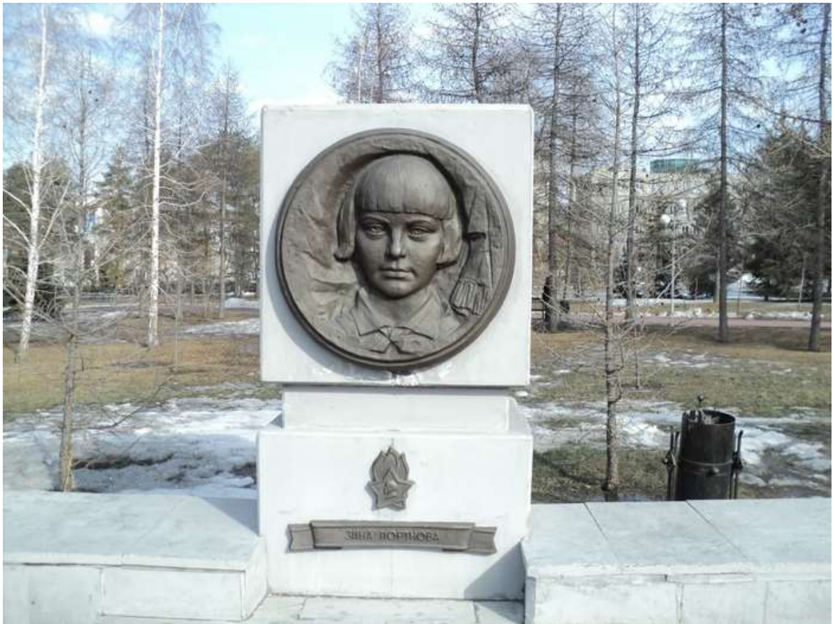
Памятник Зине Портновой на Аллее пионеров-героев