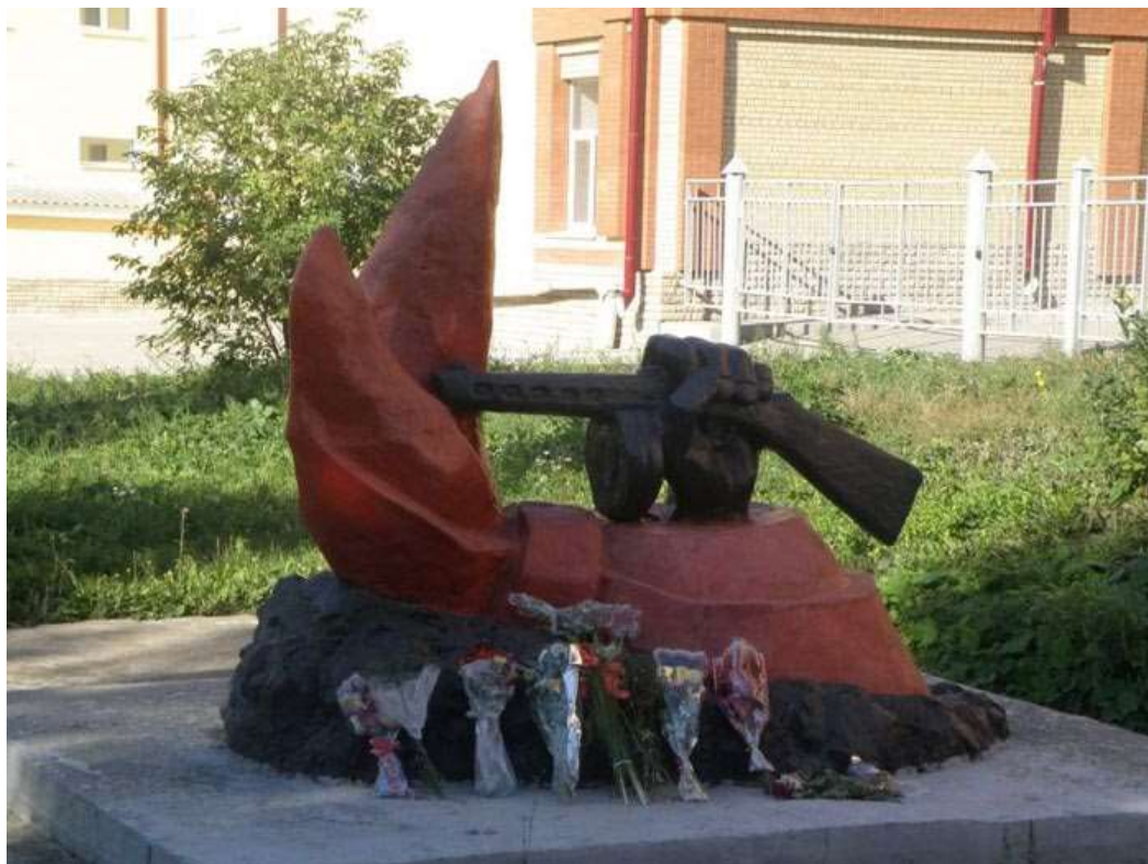
Памятник пионерам-героям войны в Лысьве, Пермский край, Россия