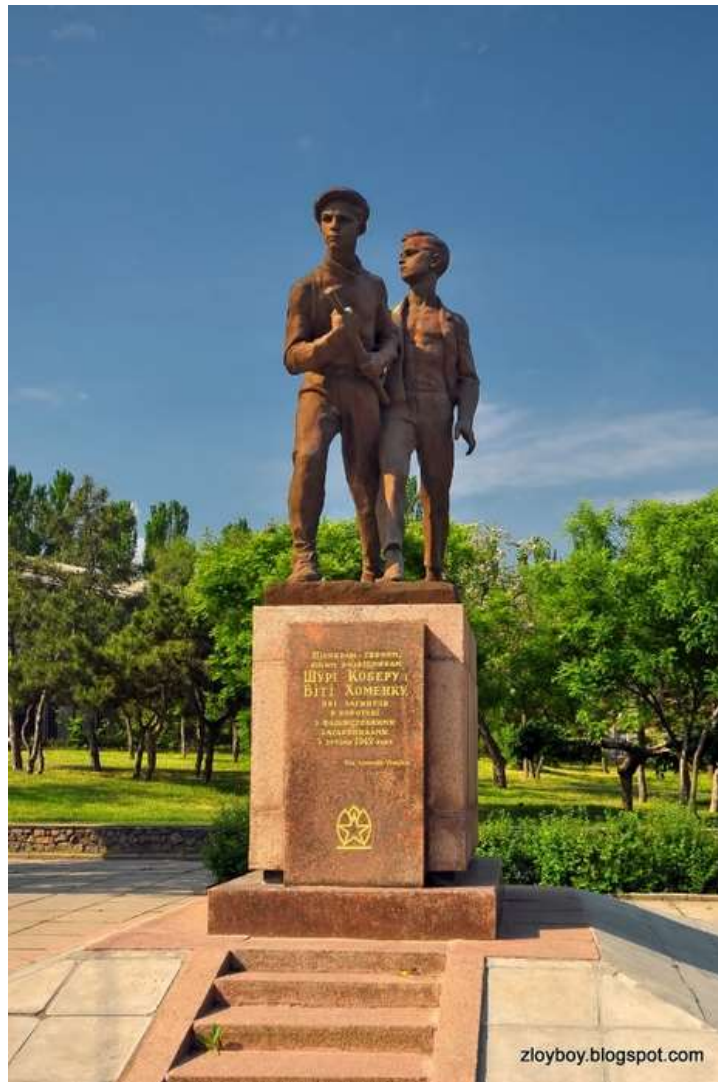
Пам'ятник Шуре Коберу и Вите Хоменко в Николаеве, Украина