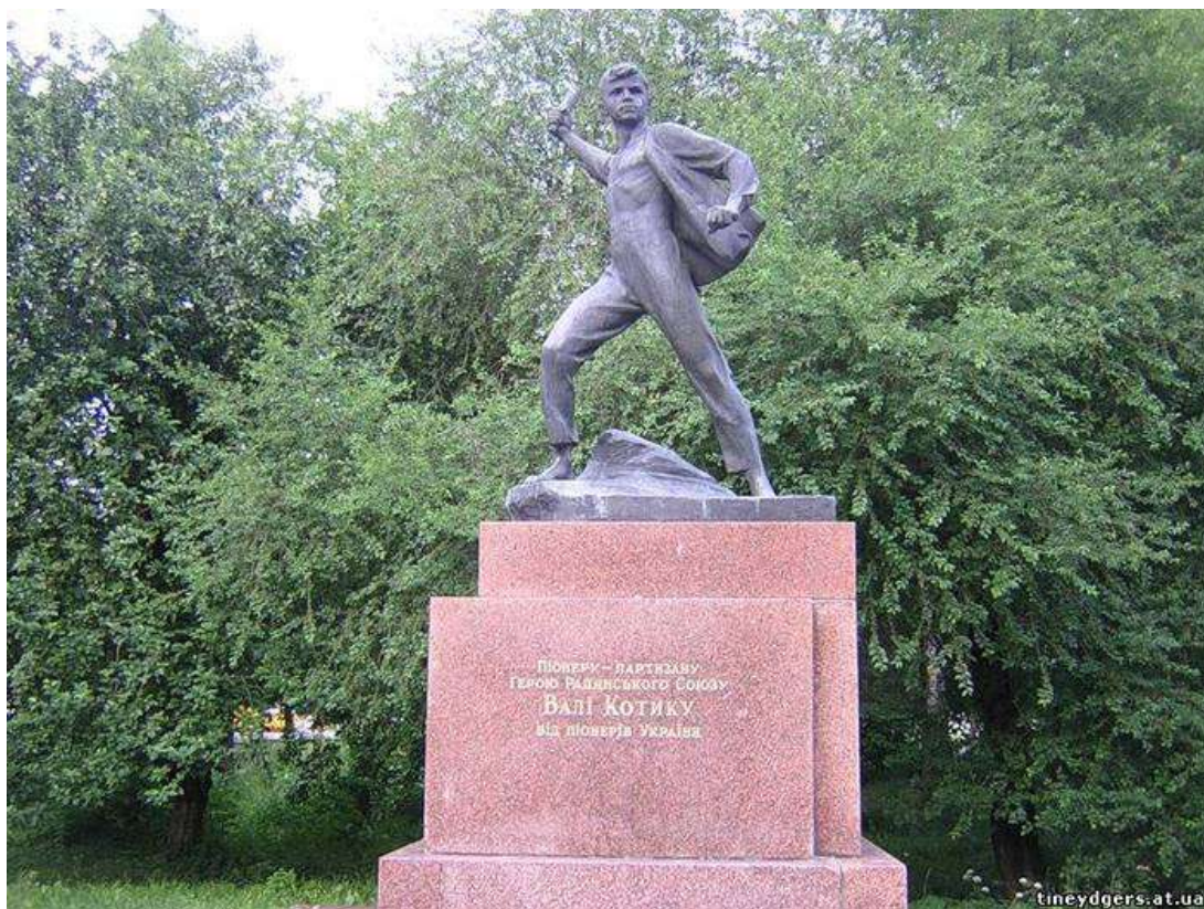
Памятник пионеру Герою Советского Союза Вале Котику в Москве, Россия