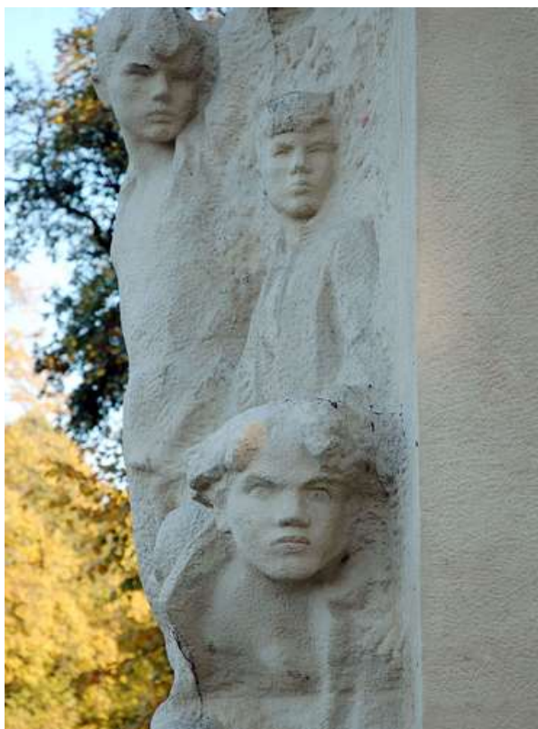
Памятник пионерам-героям в Санкт-Петербурге, Россия