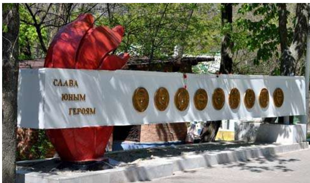
Памятники пионерам-героям, защитникам города в Ростове-на-Дону, Россия