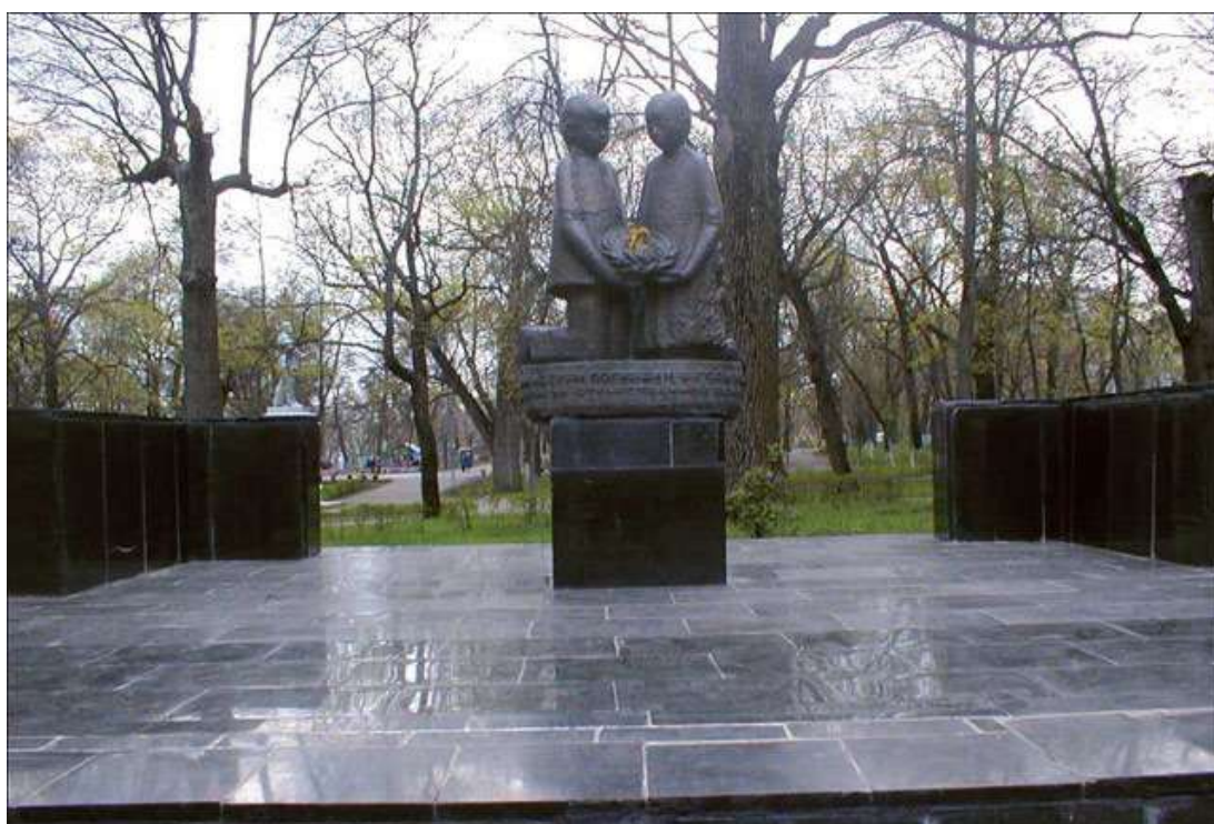
Памятник пионерам-героям в Липецке, Россия