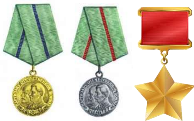
«Партизану Отечественной войны I степени» «Партизану Отечественной войны II степени» Золотая Звезда Героя войны I степени» войны II степени» Советского Союза