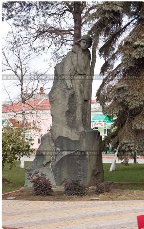
Керчь. Памятник пионеру-герою Володе Дубинину