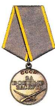
Орден Ленина Орден «Боевого Красного Знамени» Медаль «За боевые заслуги»