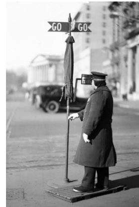
Рис.2. Светофоры начала 20 века

Первый светофор был не похож на современный. Он управлялся вручную и выглядел, как столб с двумя газовыми лампами с красными и зелеными стеклами. Его задачей было дублировать сигналы регулировщика в темное время суток. К сожалению, устройство проработало всего четыре недели. Газовый фонарь неожиданно взорвался, ранив полицейского, дежурившего возле него.