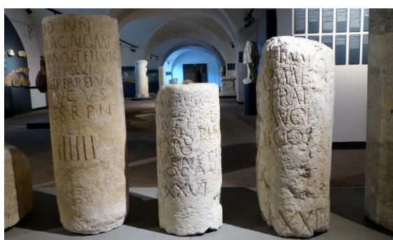
Рис.1 Мильные столбы в Древнем Риме

Самые первые правила и дорожные знаки появились в Древнем Риме. Известная фраза «Все дороги ведут в Рим» возникла не просто так. Это государство имело очень развитую дорожную сеть, которую необходимо было регулировать. Пятнадцать дорог со всех сторон света вели в этот город. На дорогах устанавливали столбы с надписями, которые указывали, какое расстояние осталось до Рима, до ближайшего города, предупреждение о повороте, год и имя правителя, который построил дорогу. Они назывались мильными столбами или миллиариями (см. рис.1). Отсчет расстояний начинался с самого главного бронзового столба, который был установлен на холме возле Римского форума.